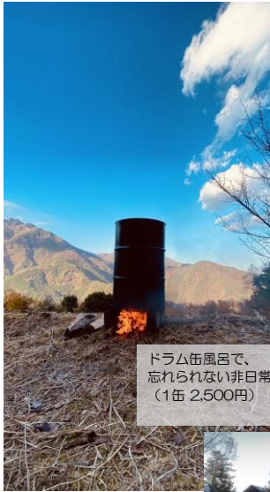
ドラム缶風呂で、 忘れられない非日常を満喫！ (1缶 2,500円)