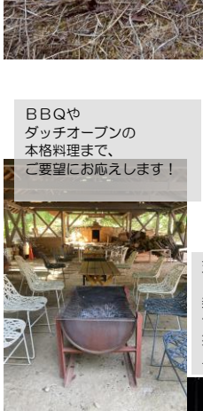
BBQや ダッチオーブンの 本格料理まで、 ご要望にお応えします！